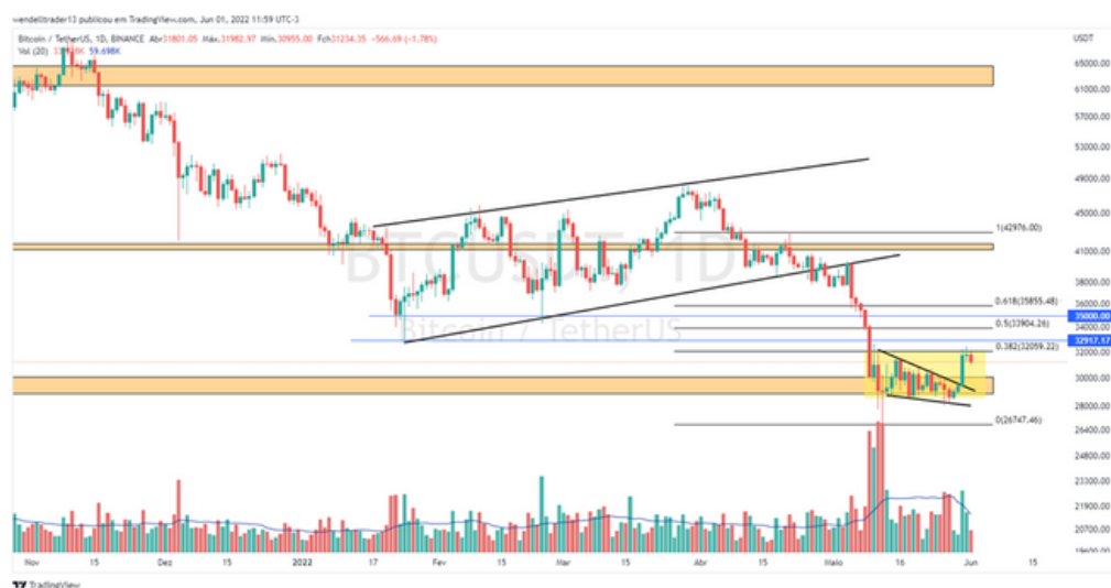
GRÁFICO DIÁRIO - BTC/USDT

*Este documento foi produzido e é de propriedade da BRAISCOMPANY BLOCKCHAIN SOLUTION. Documento de caráter informativo e não constitui, recomendação ou sugestão de investimentos, não teremos responsabilidade por qualquer decisão de compra ou venda de ativos realizado por nossos leitores, nosso trabalho constitui informar unicamente nossa opinião embasados em informações e fatos conhecidos do mercado de criptoativos, as opiniões contidas nesse documento são do nosso julgamento na data de publicação, e podem ser alteradas sem aviso previo