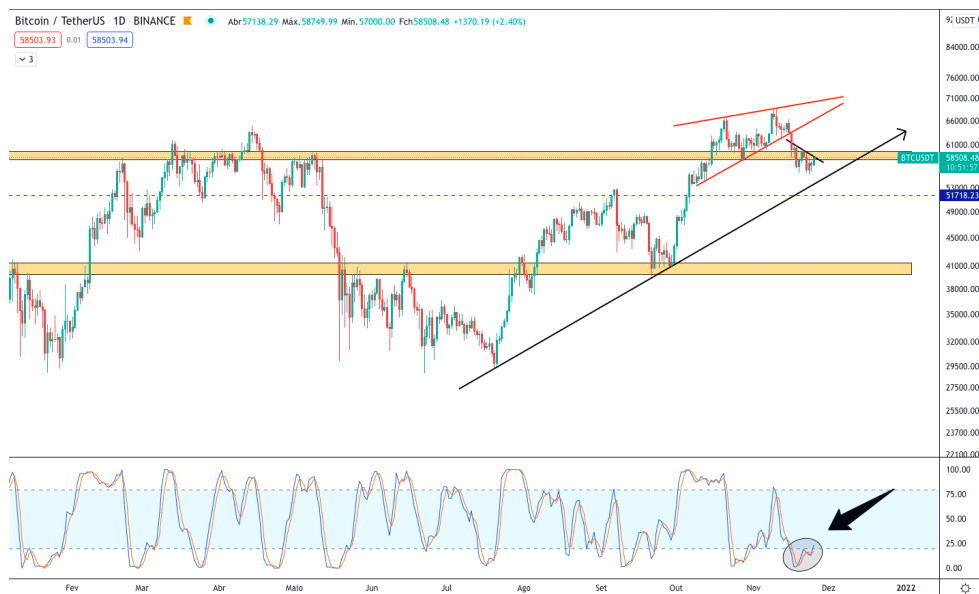
Gráfico Diário BTC