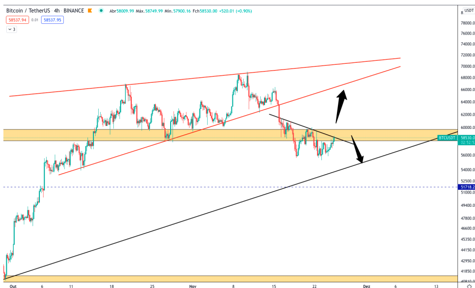
Gráfico em H4 do BTC

No período de tempo mais curto, como o de 4 horas podemos perceber melhor essa indecisão do ativo. O gráfico nos mostra que caso ele tenha força suficiente para romper a casa dos $60.000,00 dólares ele pode vir testar os $65.000,00 com facilidade, que seria basicamente um pullback da última cunha formada pelo ativo. Por outro lado, caso a criptomoeda não tenha a força compradora esperada, podemos ver o BTC ainda lateralizar e vir testar as zonas de $65.000,00 a $64.000,00 dólares.